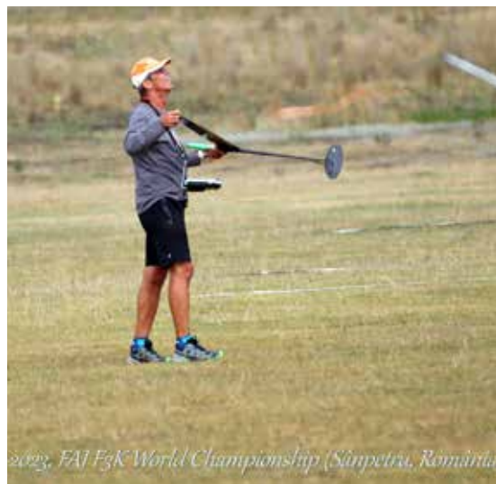
2023, FAI F3K World Championship (Sânpetru, România)