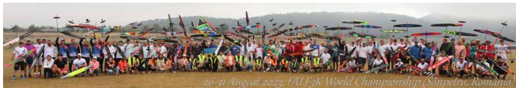
26-31 August 2023, FAI F3K World Championship (Sânpetru, România)