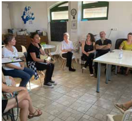
Erdélyi Ifjúsági Egyesület