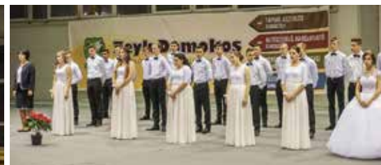
A 2019. december 20-i nagykorúsítási ünnepség pillanatképei