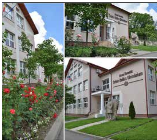
Az Orbán Balázs Gimnázium oktatási kínálata a 2020-2021-es tanévre