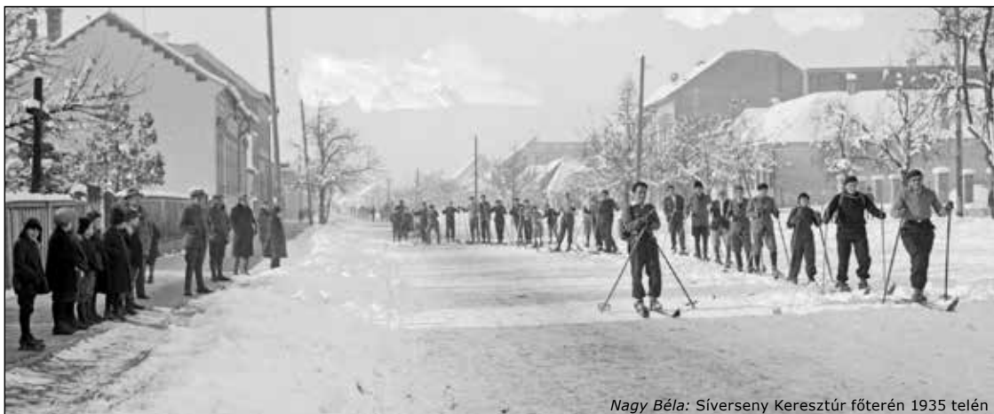
Nagy Béla: Síverseny Keresztúr főterén 1935 telén