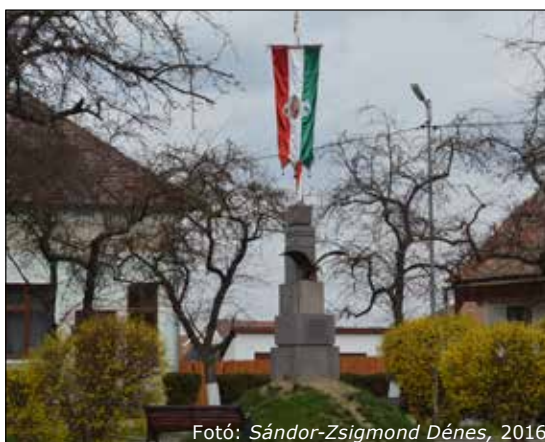
Fotó: Sándor-Zsigmond Dénes, 2016

1941. szeptember 14-én nagy ünnep szentnője volt Székelykeresztúr és környéke: ekkor került felavatásra az az országzászló, amelyet az Országzászló-mozgalom keretében Rákoscaba ajándékozott és hozott el Székelykeresztúrra. Illő, hogy most a kerek 75 éves évfordulón megemlékezzünk róla.