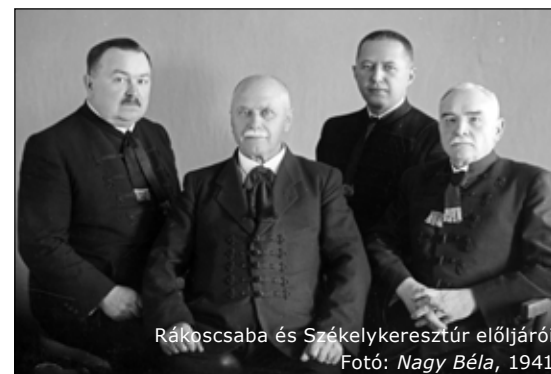
Rákoscscaba és Székelykeresztúr előljárói Fotó: Nagy Béla, 1941