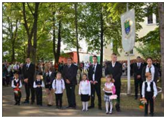
Berde Mózes Unitárius Gimnázium