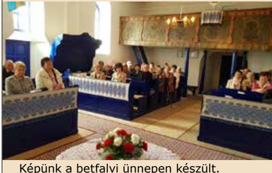
Képünk a betfalvi ünnepen készült.

1991 óta, amikor az ENSZ közgyűlése az Idősek Világnapjává nyilvánította október 1-jét, ezen a napon világszerte a szépkorúakat köszöntjük. Városunkban minden egyház-köztség istentisztelettel egybekötött ünneppel, virággal, finom falatokkal, köszöntő beszédekkel tette felejthetetlen élménnyé szépkorú tagjai számára ezt a napot.